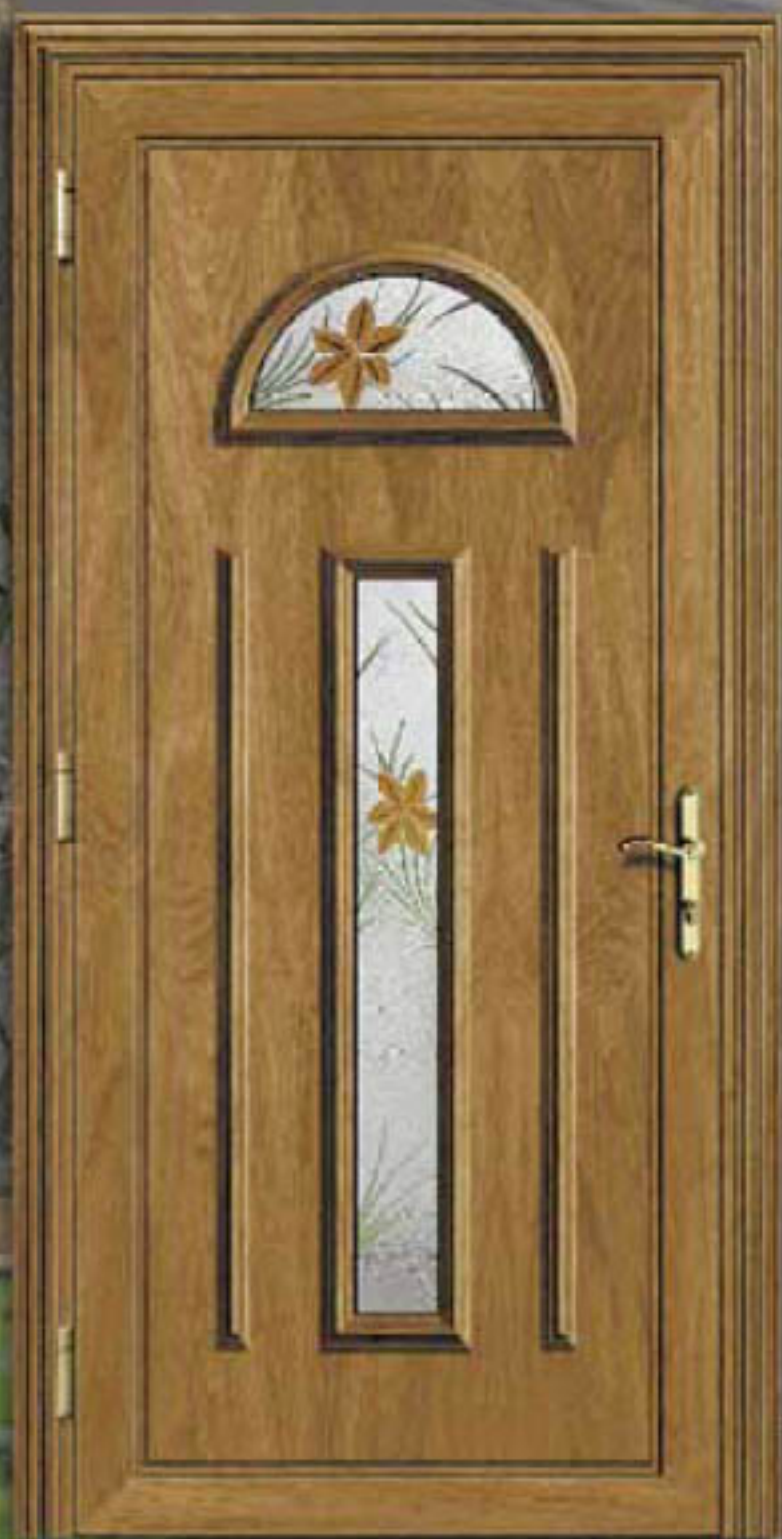
ARES Roble Oscuro