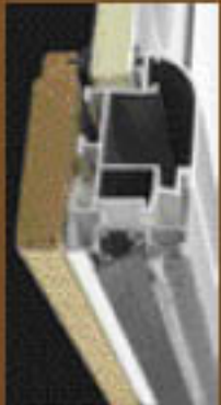
Doble sistema cortavientos