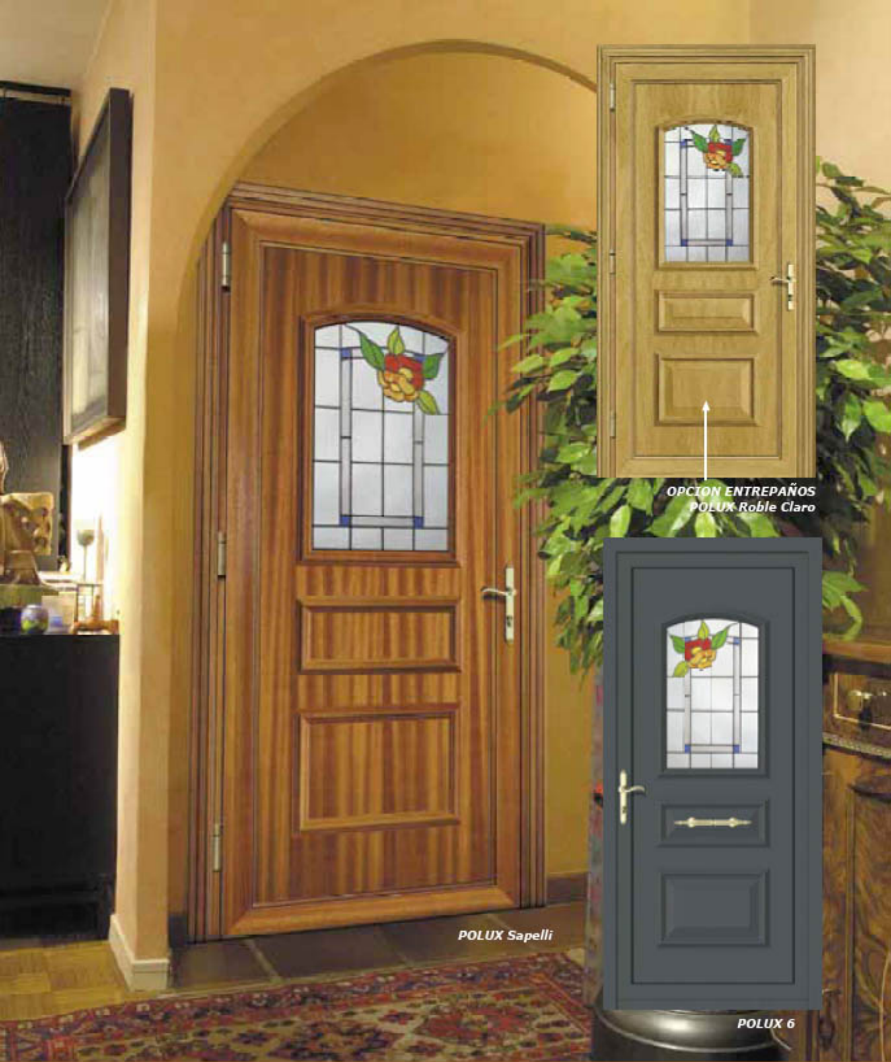
OPCION ENTREPAÑOS POLUX Roble Claro