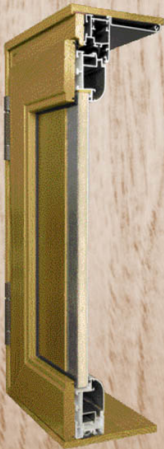
Detalle de sección transversal de la puerta