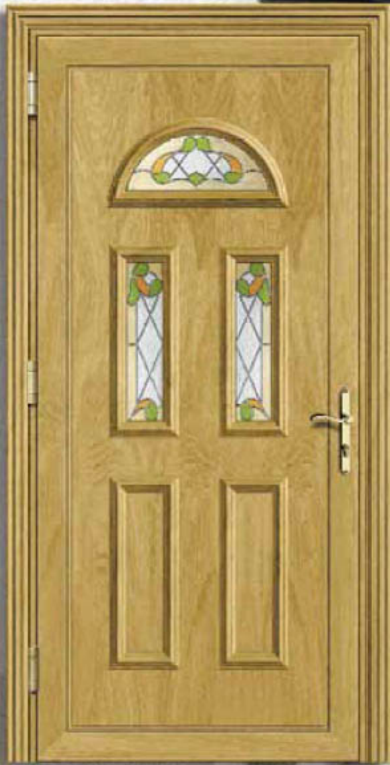
POSEIDON Roble Claro