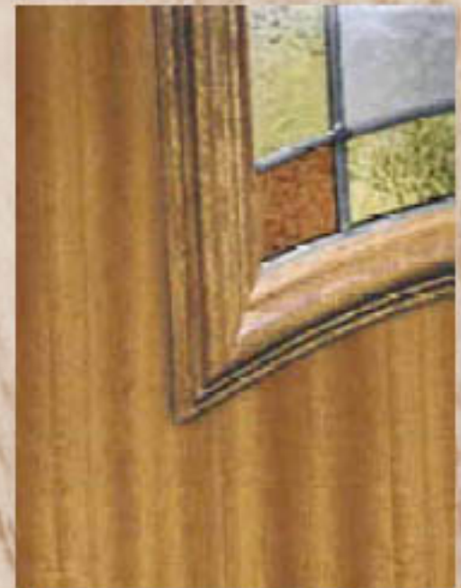
Paneles Cara Madera