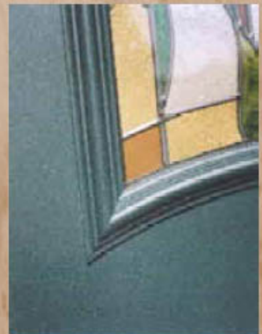
Paneles Cara Aluminio. Chapa de 2 mm.

Todos los paneles de nuestra Serie Oro, pueden hacerse mixtos (Aluminio/Madera) con gama completa de cristales.