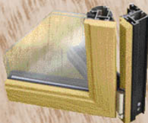
Detalle de esquinero de la ventana oscilobatiente