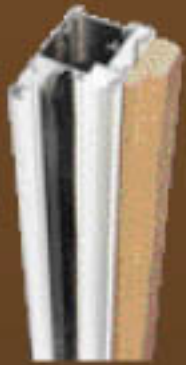
Perfil de marco especial. (No necesita mecanización)