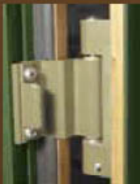
Bisagra de seguridad antipalanca