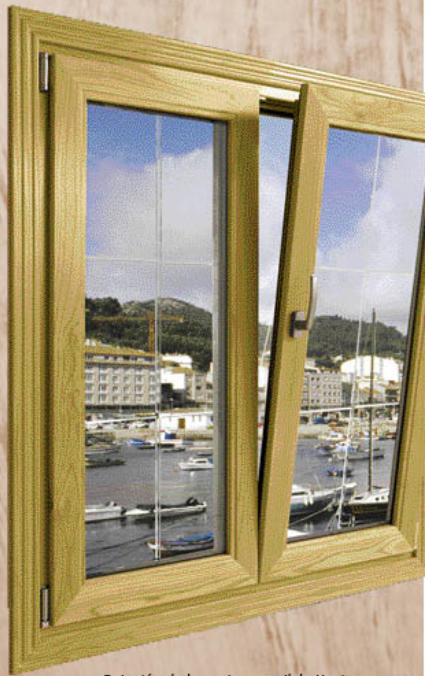
Rotación de la ventana oscilobatiente