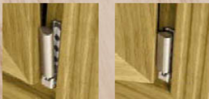
Detalles de bisagra de la ventana oscilobatiente